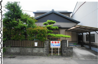
北側外観（更地渡しです）