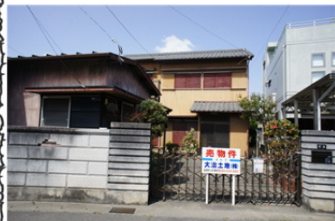
南側外観（更地渡しです）