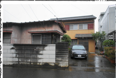
南側外観（更地渡しです）